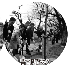
背割堤桜の保護・育成・新規植樹