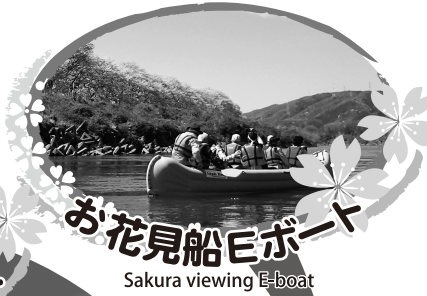
お花見船Eボート Sakura viewing E-boat