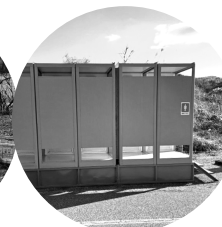
仮設トイレの設置