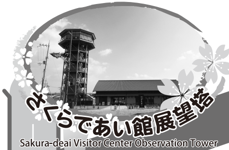
さくらであい館展望塔 Sakura-deai Visitor Center Observation Tower