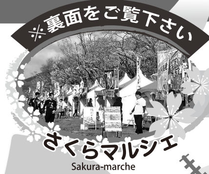
※裏面をご覧ください さくらマルシェ Sakura-marche

これからも背割堤の桜をお楽しみいただくために、みなさまのご理解・ご協力をお願いいたします。