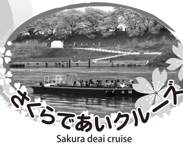
さくらであいクルーズ Sakura deai cruise